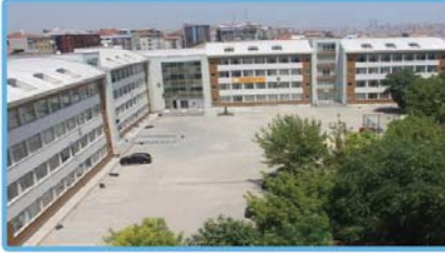
Siyavuşpaşa MTAL (Yiyecek-İçecek Hizmetleri-Grafik-Fotoğraf Alanı)