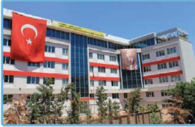
Şehit Mehmet Karaaslan Uluslararası Kız Anadolu İmam Hatip Lisesi (Kız)