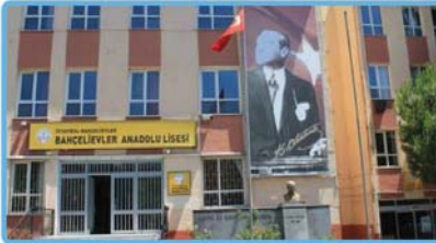
Bahçelievler Anadolu Lisesi (İngilizce-Almanca)