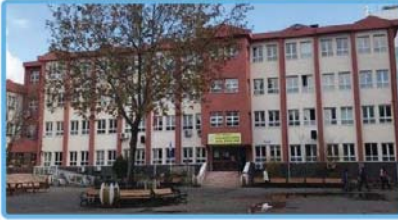
Prof. Dr. Mümtaz Turhan Sosyal Bilimler Lisesi