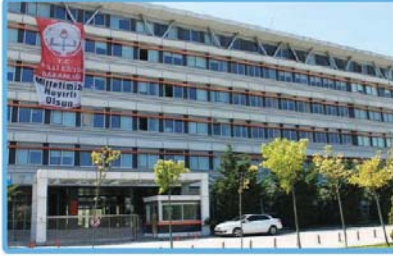
15 Temmuz Şehitleri Anadolu İmam Hatip Lisesi (Erkek)