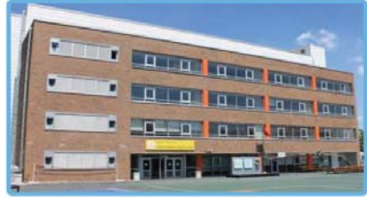
Adnan Menderes Anadolu Lisesi