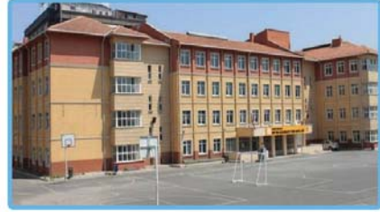
Şehit Erol Olçok MTAL (Raylı Sistem Tek. - Endüstriyel Otomasyon Tek.)