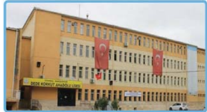
Dede Korkut Anadolu Lisesi